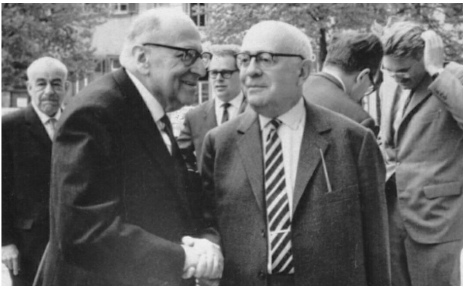
Abbildung 1 Max Horkheimer (v. links) und Theodor W. Adorno (v. rechts) in Heidelberg, April 1964

Erst nach Jahren ihrer Veröffentlichung findet eine breitere Rezeption der Dialektik der Aufklärung statt, was vor allem auf die Verbreitung des Textes unter den Studenten in den 1960er-Jahren zurückzuführen ist. Als die deutsche Studentenbewegung, die starkes Interesse an Adornos und Horkheimers Ideen hat, sich im Laufe der Zeit radikalisiert, distanzieren sich die geistigen Väter der Studenten von ihnen und kritisieren ihre Anwendung von Gewalt und ihren blinden Aktivismus. Gegenüber dem Spiegel sagt Adorno – kurz nachdem mehrere seiner Vorlesungen von studentischem Protest gestört wurden – er «hätte zwar ein theoretisches Modell aufgestellt, hätte aber nicht ahnen können, dass Leute es mit Molotow-Cocktails verwirklichen wollen» 12 .