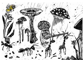
Stärke der Ameisen