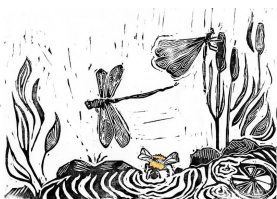
Eleganz der Libellen