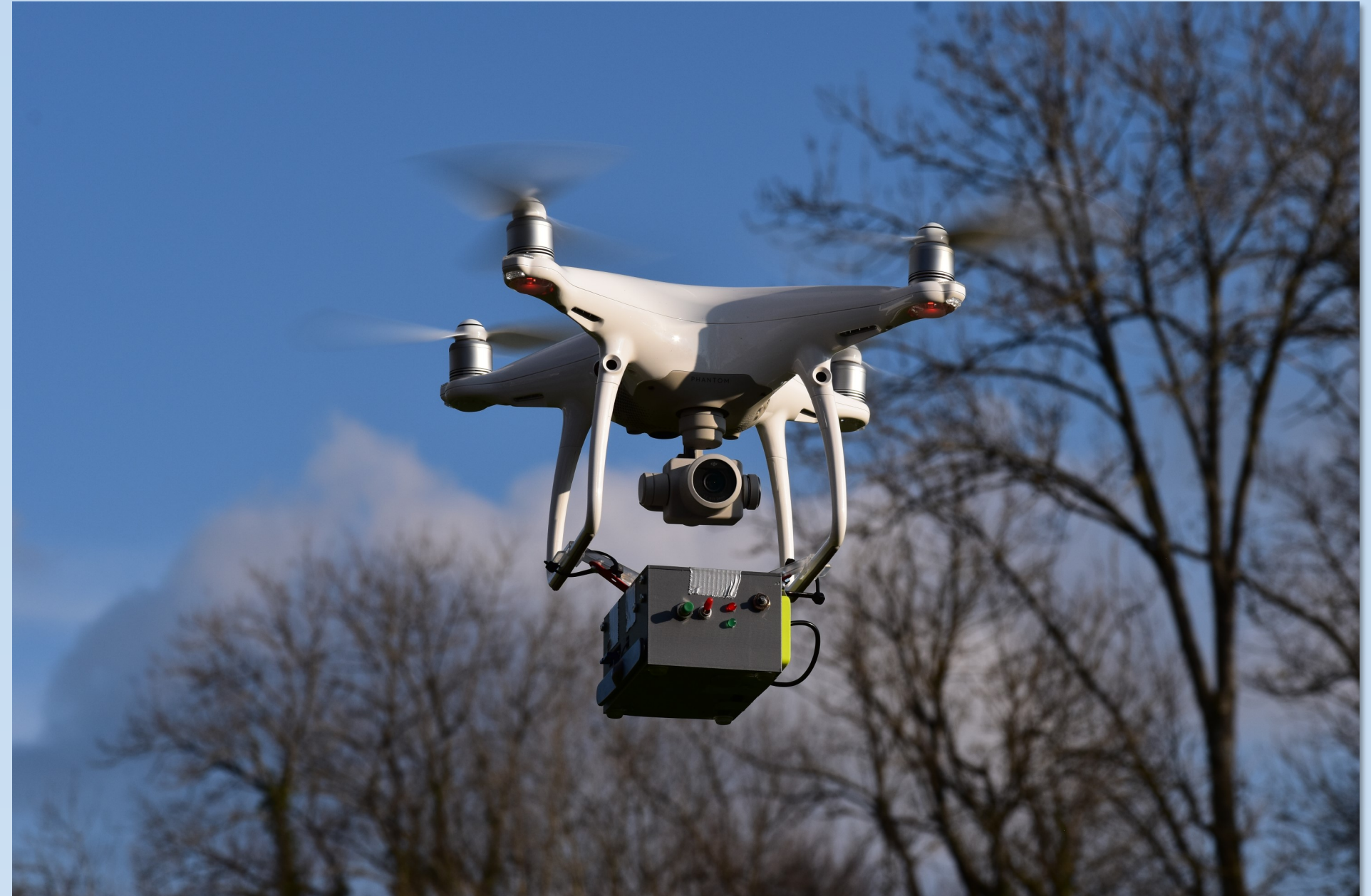
Abb. 1: Das Luftmodul unter der Drohne

Mein finales Produkt kann mithilfe einer Drohne über einen Lawinenkegel fliegen und zeigt auf wenige Meter genau die Position eines Verschütteten an, der ein Lawinenschuttensuchgerät (LVS) bei sich trägt.